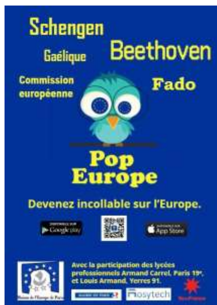
Affiche de l'application Pop europe

Depuis le mois de mai 2018, l'application est disponible gratuitement sur Apple Store et Play Store. Une page Facebook est également dédiée à l'application Pop Europe.