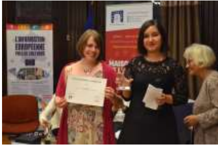
Remise du Prix de l'initiative européenne le 11 juin 2018

Fruit de la collaboration entre la Maison de l'Europe de Paris et le Club de la Presse Européenne , le Prix de l'initiative européenne a connu en 2018 sa 15 e édition. Il est attribué chaque année à des journalistes ou à des médias qui se sont signalés par la qualité de leurs informations et de leurs commentaires sur l'Europe.