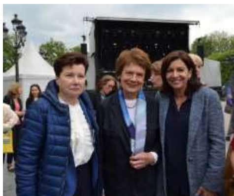
Hanna Beata Gronkiewicz-Waltz, Catherine Lalumière et Anne Hidalgo

Lors de cette journée, une place importante a également été laissée à la musique. Des concerts, dont les artistes européens ont été sélectionnés par Europavox, ont eu lieu sur le parvis de 12h00 à 14h00 et de 18h00 à 22h00.