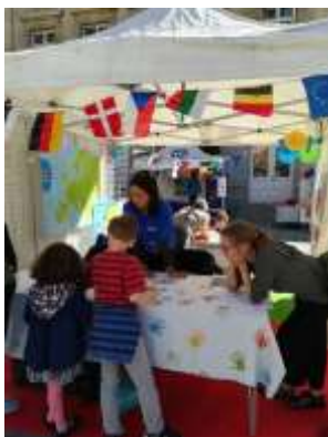
Stand « Memory » de la Maison de l'Europe de Paris à la Journée européenne des langues