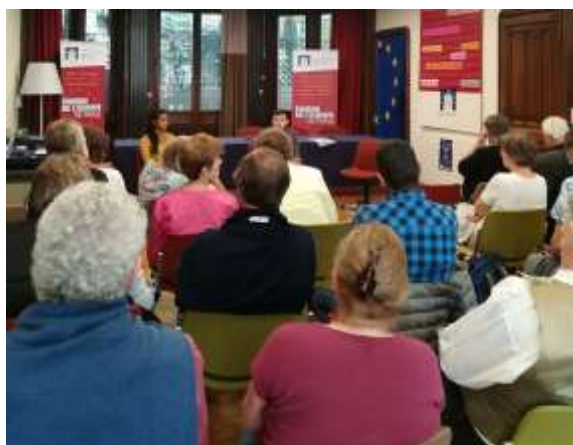
Consultation citoyenne du 10 octobre avec des citoyens allemands de la ville de Duisburg

La dernière consultation citoyenne ayant eu lieu à la Maison de l'Europe de Paris s'est tenue le 10 octobre. A cette occasion, nous avons reçu des citoyens allemands de la ville de Duisburg. Cette consultation portait sur l'acceptation des politiques européennes au sein de la société Française et la réception par les citoyens français des réformes mises en œuvre par le Président Macron. La montée du populisme et de l'extrême droite en France a également été évoquée.