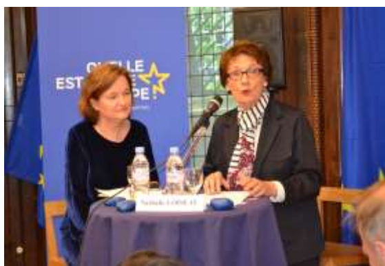
Consultation citoyenne du 25 avril 2018 « Le numérique et les médias font-ils bon ménage avec Nathalie LOISEAU

A la Maison de l'Europe de Paris, la consultation citoyenne du 25 avril 2018 avait pour titre : Le numérique et les médias font-ils bon ménage ? A été notamment abordée la question de la prolifération de "fausses nouvelles" et la désinformation en ligne qui a suscité beaucoup d'intérêts. Lors de cette consultation Nathalie LOISEAU , ministre chargée des affaires européennes a répondu aux questions de l'auditoire et a recueilli les propositions.