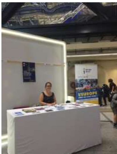
Stand de la Maison de l'Europe de Paris à la Journée des Sciences organisée par la Cité des Sciences

En septembre, la Maison de l'Europe a participé à l'anniversaire des 10 ans de la Maisons des associations du 17ème. En octobre, l'association a organisé plusieurs activités dans le cadre des Erasmus Days . Enfin, des stands ont été mis en place, notamment à l'ESCP Europe, lors de la Journée de l'Europe qui a eu lieu le 18 novembre 2018 et à la Journée des Sciences organisée par la Cité des Sciences, le 5 octobre 2018.