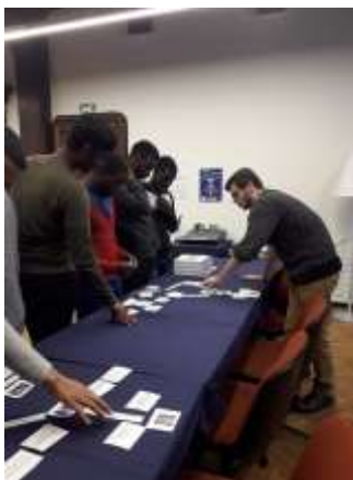
Des élèves du lycée René CASSIN lors de notre formation sur le fonctionnement de l'Union européenne et les valeurs européennes

Au total 74 adultes et 362 élèves ont été formés dans le cadre du projet Roulez l'Europe, Roulez jeunesse.