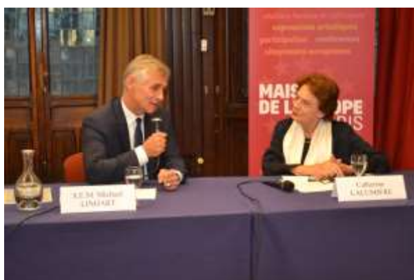
Michael Linhart, Ambassadeur d'Autriche à Paris et Catherine Lalumière