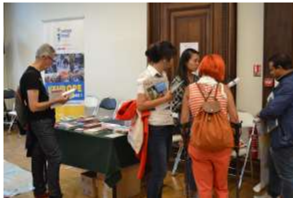
Les Journées européennes du patrimoine

Au programme, expositions culturelles, animations pédagogiques et musicales, et informations générales sur l'Union européenne.