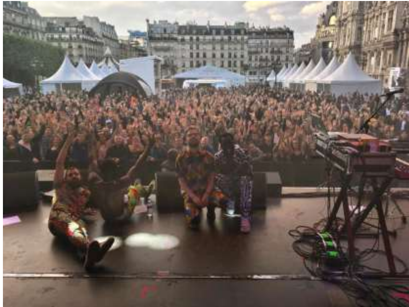
Concert sur le Parvis de l'Hôtel de Ville de Paris avec une photo prise par Threes+ the Shine