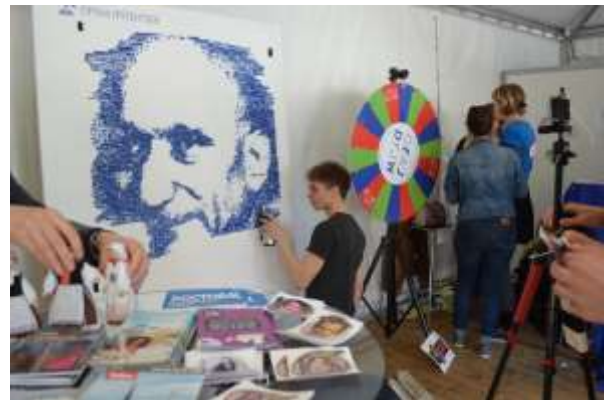
Village européen avec plus de 30 stands associatifs

Chaque année, les pays qui assurent la présidence du Conseil de l'Union européenne sont représentés par leur ambassade sur le parvis. Pour cette édition 2017, c'est donc Malte et l'Estonie qui se sont prêtés au jeu.