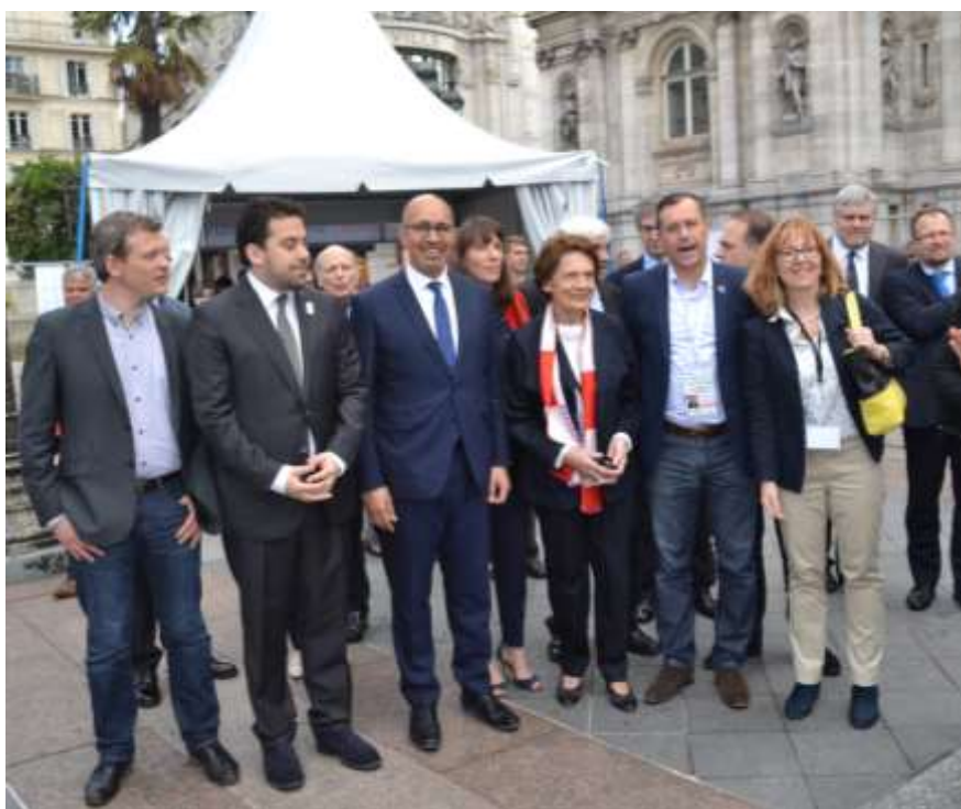
Visites officielles du Village européen

La Mairie de Paris, la Maison de l'Europe de Paris , la Commission européenne , le Parlement européen en collaboration avec Europavox et leur cinquantaine de partenaires ont organisé la 12 ème édition de « la Fête de l'Europe », le 13 mai 2017, sur le parvis de l'Hôtel de Ville de Paris. Chaque année à cette période, l'Europe rend hommage à la Déclaration du 9 mai 1950 de Robert Schuman qui proposait, déjà à l'époque, une forme d'Union européenne à travers la création de la Communauté Européenne du Charbon et de l'Acier (CECA). Placé sous le thème de la « Mobilité », le village européen a proposé des animations, des débats et des concerts tout au long de cette journée.