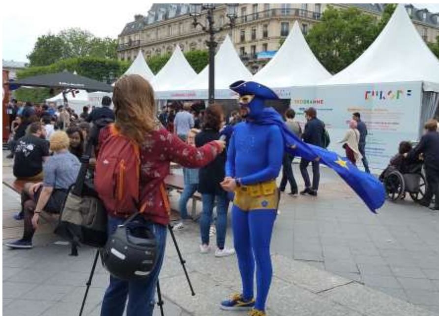
Capitaine Europe était sur le parvis de l'Hotel de Ville, pour le plus grand bonheur des petits et des grands

La Fête de l'Europe est l'occasion pour tous les partenaires d'informer le grand public et de le sensibiliser sur les questions européennes. Moment de partage et d'échange, l'événement laisse aussi place à la culture et au divertissement.