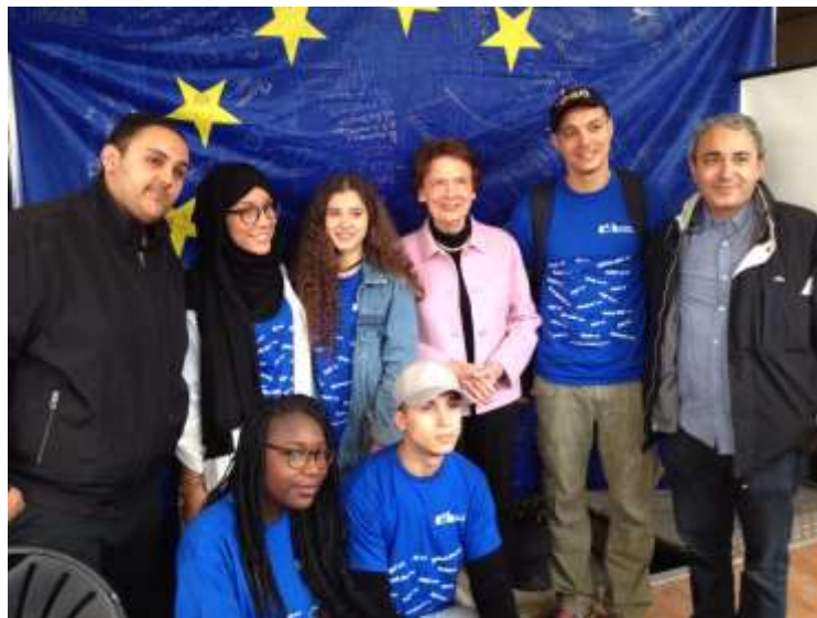
La fête de l'Europe à Aulnay-Sous-Bois

Pour un maillage complet du territoire francilien, et dans le cadre de notre mission d'information sur la citoyenneté européenne, la Maison de l'Europe de Paris a fourni un soutien aux Mairies d'Ile-de-France en termes de documentations, d'affiches ou d'expositions sur le fonctionnement de l'Union durant la Fête de l'Europe. Plus de 12 fêtes de l'Europe en Ile de France ont été organisées. (Asnières-sur-Seine; Aulnay-sous-Bois; Créteil; Clichy-sous-bois ; Drancy; Montreuil ; Issy-les Moulineaux ; Vincennes ; Villemomble ; Ivry-sur-Seine ; Suresnes ; Yerres)