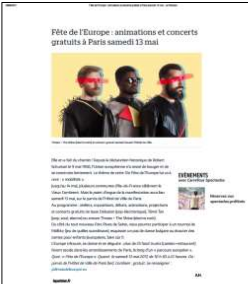
Article de presse paru dans Le Parisien et dans 20minutes