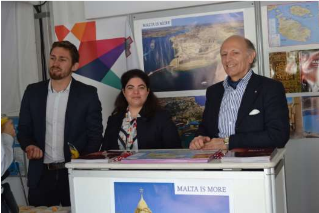
L'espace : Conseil de l'Union européenne avec l'Ambassade de Malte et l'Ambassade de l'Estonie

Associations, organisations et ambassades ont tous participé activement à l'événement. L'équipe des organisateurs les en remercie à nouveau ainsi que TeamWork pour son implication dans l'organisation de l'événement.