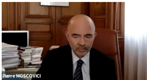
Pierre Moscovici, Premier Président de la Cour des Comptes échange avec Nicole Gnesotto, professeure au CNAM, chaire « Union européenne : institutions et politiques » sur les réformes pour l'avenir de l'Europe le 28 avril 2021

La Conférence sur l'avenir de l'Europe a été sans doute l'une des principales actualités européennes de 2021. Afin d'encourager la participation et l'adhésion des citoyens à ce grand processus démocratique européen,