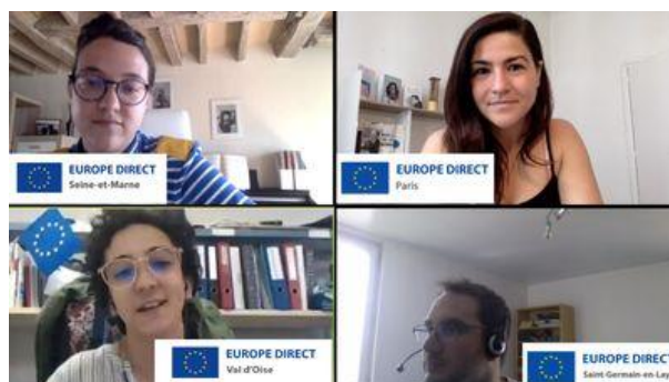
De gauche à droite et de haut en bas, les Europe Direct de Seine-et-Marne, Paris, Val d'Oise et Saint-Germain en Laye

De plus, dans le cadre de la Conférence sur l'avenir de l'Europe, la Représentation de la Commission européenne en France a également désigné le centre Europe Direct Paris HUB en Ile-de-France. Désigné comme un point d'information privilégié pour la promotion de ce processus démocratique européen, l'association a ainsi redoublé d'effort afin d'amener les citoyens à faire entendre leur voix pour le futur de l'Europe en multipliant les campagnes d'informations et les projets et activités autour de la COFOE. La Maison de l'Europe de Paris a également dédié un onglet spécial de son site internet à l'actualité de la Conférence et a mis en place une lettre d'information commune entre les quatre Europe Direct d'Ile-de-France pour informer le plus grand nombre sur les activités et actualités de la COFOE.