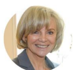
Elisabeth GUIGOU Vice-présidente