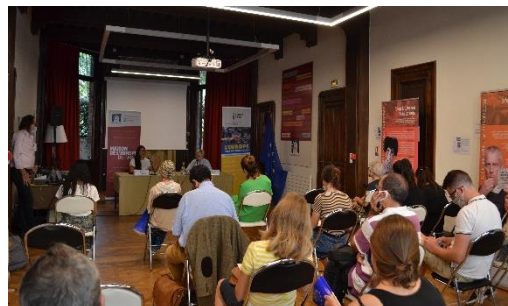
Des conférences en présentiel dans le respect des recommandations sanitaires

Les conférences-débats organisées par la Maison de l'Europe de Paris visent à sensibiliser les citoyens aux grandes thématiques européennes afin de favoriser l'appropriation par tous des enjeux de la construction européenne. Ces conférences-débats offrent au grand public une approche des divers sujets traités. Cette année, la Maison de l'Europe de Paris a alterné entre un format de conférence en présentiel dans ses locaux, en ligne, ou au format hybride. Le format numérique lui a notamment permis de faire débattre des personnalités politiques, experts ou encore universitaires qui n'auraient pu se rencontrer en présentiel. Les intervenants, de nationalités et d'horizons différents, ont permis la confrontation des idées et un brassage important des opinions. Cette diversité a favorisé les débats et échanges, notamment avec l'audience, qui malgré le format numérique, a pu grâce aux plateformes en ligne, échanger et poser ses questions aux panels.